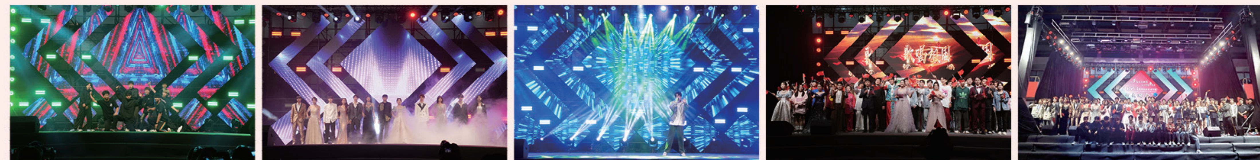
冰火舞蹈协会 - 《Hippy hippy shake》 闪亮 T 台协会 - 《闪亮 T 台》 自动化与物联网学院 - 《都走了》 大合唱《歌唱祖国》 全体演职人员合影

9月26日晚，郑州职业技术学院2023年“以梦为马启新程，山川作笔书华章”迎新晚会在大学生活动中心精彩上演。晚会由共青团郑州职业技术学院委员会主办，校学生会、校学生社团联合会联合承办，全校6000余名新生线上线下相结合的方式参与观看。