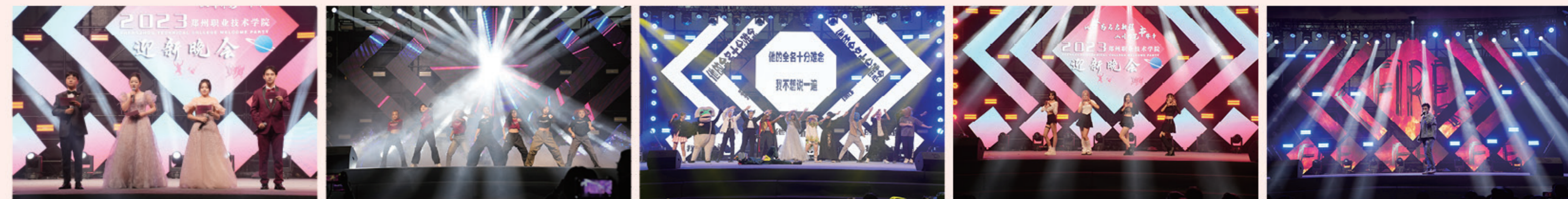
主持人亮相 校舞蹈队 - 《Fighting》 星漫美术协会 - 《达拉崩吧》 冰火舞蹈协会 - 《Love sick girls》 爱乐坊协会 - 自制歌曲