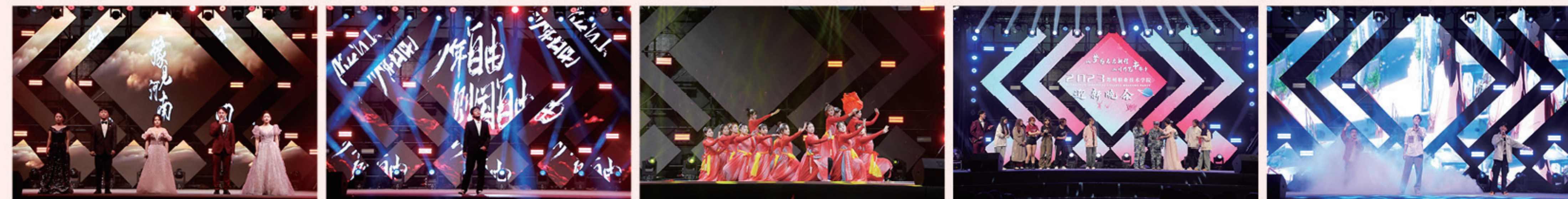
校播音主持人 - 《老家河南》 财经与金融学院 - 《少年中国说》 校舞蹈队 - 《星星之火》 游戏环节 电子商务学院、新能源汽车学院、智能制造学院 - 歌曲串烧